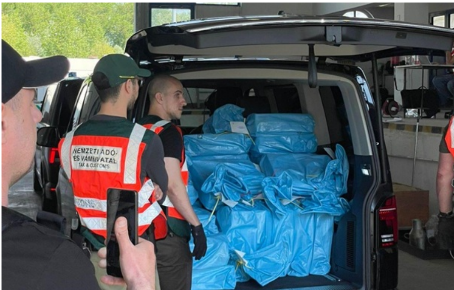
Ощадбанк також оприлюднив фотографії з повернутими цінностями