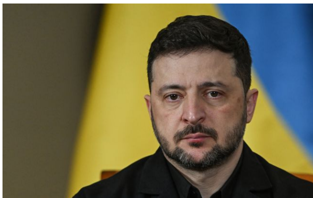
Фото: Володимир Зеленський (GettyImages)

Президент України Володимир Зеленський заявив, що інформація Росії про захоплення значних територій не відповідає дійсності та пояснив реальну ситуацію на фронті.