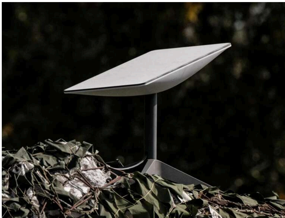
Схеми через «дропів»: Термінали Starlink потрапляють до Росії через українських посередників, – росЗМІ

Російське опозиційне видання повідомляє, що українці масово реєструють на себе термінали Starlink і активують їх для подальшого продажу російським військовим з метою використання на фронті.