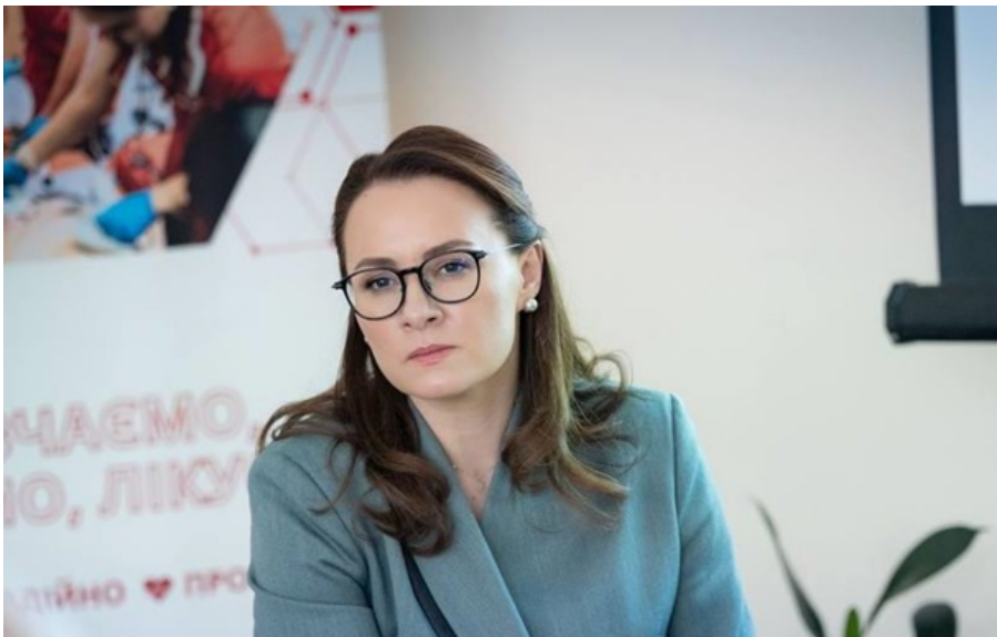
Грант JICA піде на потреби розмінування та меддопомоги, зауважила Юлія Свириденко

ДСНС отримає техніку на суму 984 млн грн, а ще 140 млн грн піде на оснащення медзакладів МВС, розповіла Юлія Свириденко.