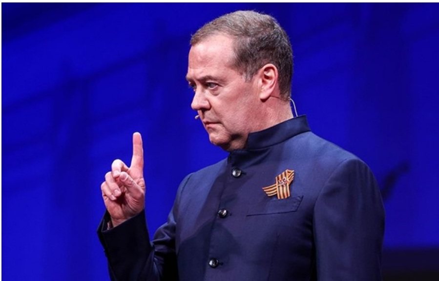
Фото: Російські ЗМІ (ілюстративне фото)

У підручниках за редакції Медведева стверджується: "сучасна російська наука" заперечує, що СРСР був тоталітарною державою