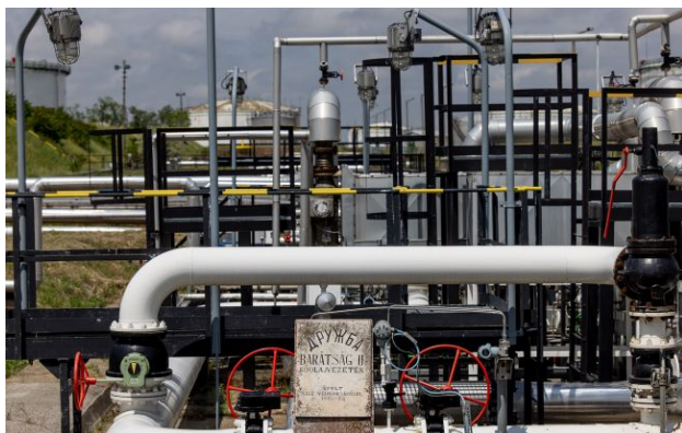
Угорщина та Словаччина отримали перші партії нафти по "Дружбі"

Угорщина та Словаччина сьогодні, 23 квітня, отримали перші партії російської сирої нафти по відремонтованому нафтопроводу "Дружба".