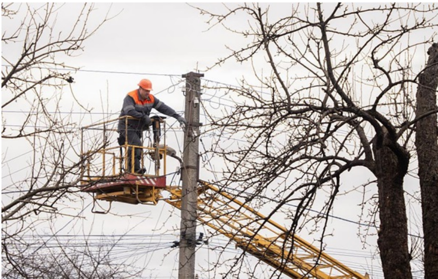
Ситуація в енергосистемі може змінитись, зазначили в компанії