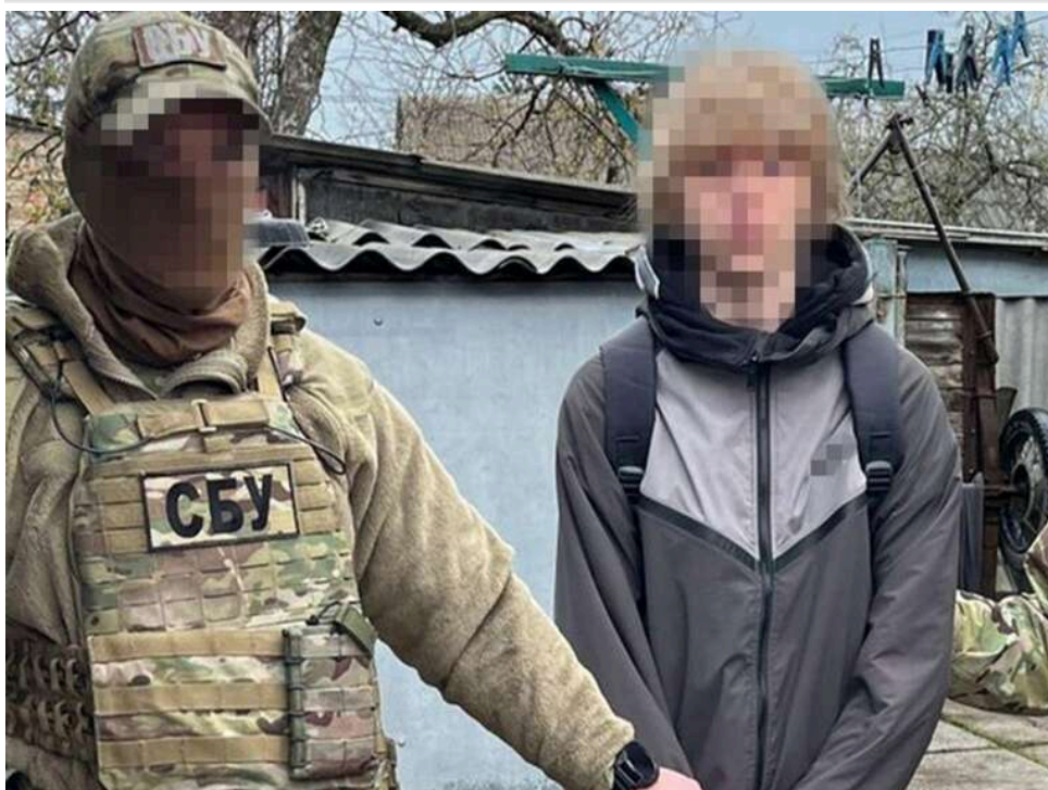
Бомби, рушниці та «справедлива мета»: СБУ запобігла терактам у ліцеях, які готували завербовані Росією школярі

СБУ повідомляє про підготовку терактів у двох школах Кіровоградської та Одеської областей.