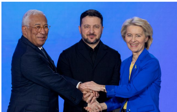
Фото: президент Євроради Антонію Кошта, президент України Володимир Зеленський та президентка Єврокомісії Урсула фон дер Ляєн

Євросоюз розблокував для України кредитний пакет на 90 мільярдів євро.