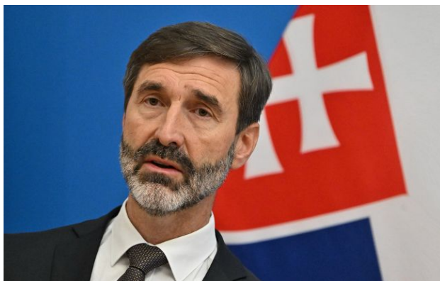
Фото: Юрай Бланар (Getty Images)

Міністр закордонних справ Словаччини Юрай Бланар доручив представнику країни в ЄС не блокувати письмове затвердження 20-го пакета санкцій проти РФ, якщо в роботі "Дружби" не буде збоїв.