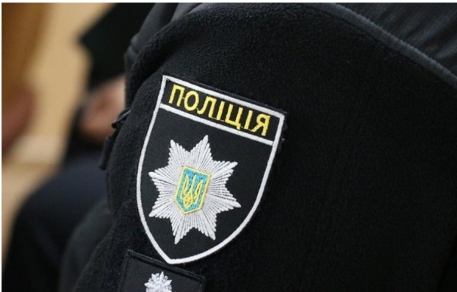
В облуправлінні Нацполіції висловили співчуття рідним та близьким загиблого

Попередньо, йдеться про самогубство правоохоронця. Обставини трагедії розслідуватимуть слідчі ДБР.