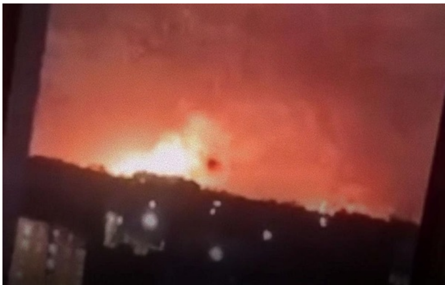
Пожежа на НПЗ у Кстово 5 квітня

Також підрозділи Сил оборони уразили низку логістичних та інших важливих об'єктів противника.