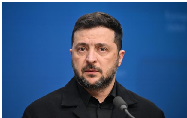
Фото: президент України Володимир Зеленський (Getty Images)

Україна розраховує отримати перший транш із 90 млрд євро від ЄС до кінця травня - початку червня. Кошти підуть на армію, виробництво зброї та підтримку громадян.