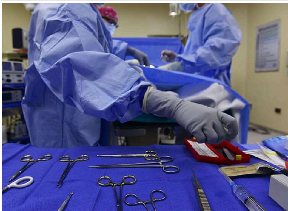
Українські лікарі з прифронтових лікарень поділилися досвідом із польськими колегами у Вроцлаві

Польські лікарі переймають досвід у українських колег з прифронтових лікарень – у Вроцлаві відбулася спільна конференція.