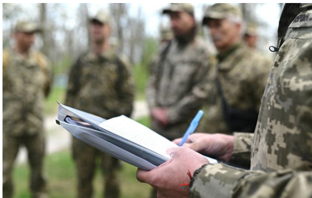
Фото: під Луцьком на даху побилися військовий ТЦК та чоловік

У селі Струмівка під Луцьком сталася бійка між працівником ТЦК і цивільним. Військовий погрожував стріляти, а потім скинув з даху чоловіка, який перебував у розшуку, і впав сам.