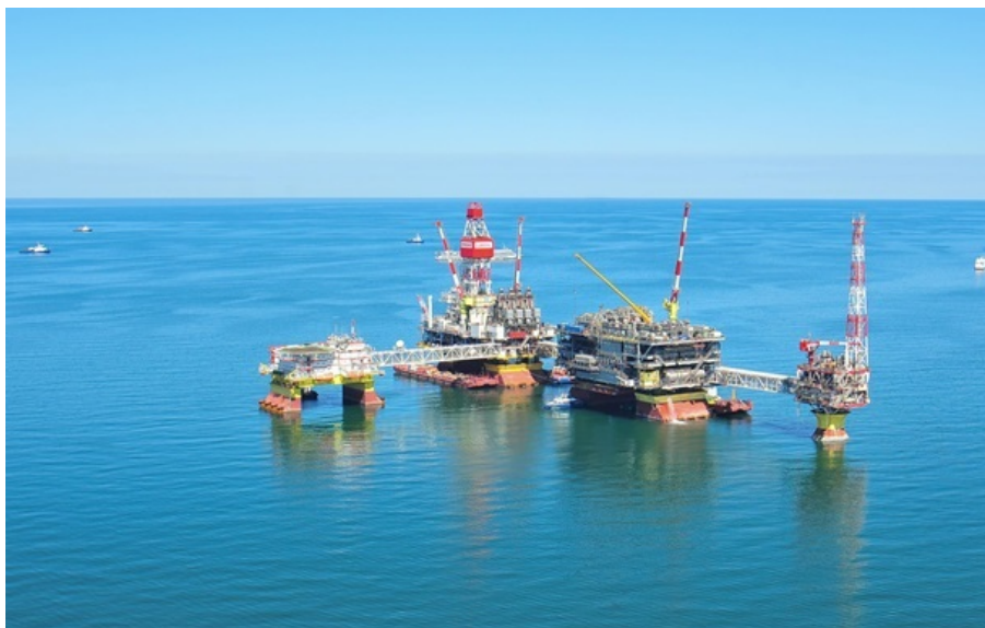
Видобуток нафти на родовищі імені В. Грайфера

Бурові платформи знаходяться на півночі Каспійського моря за майже 1000 кілометрів від лінії бойового зіткнення.