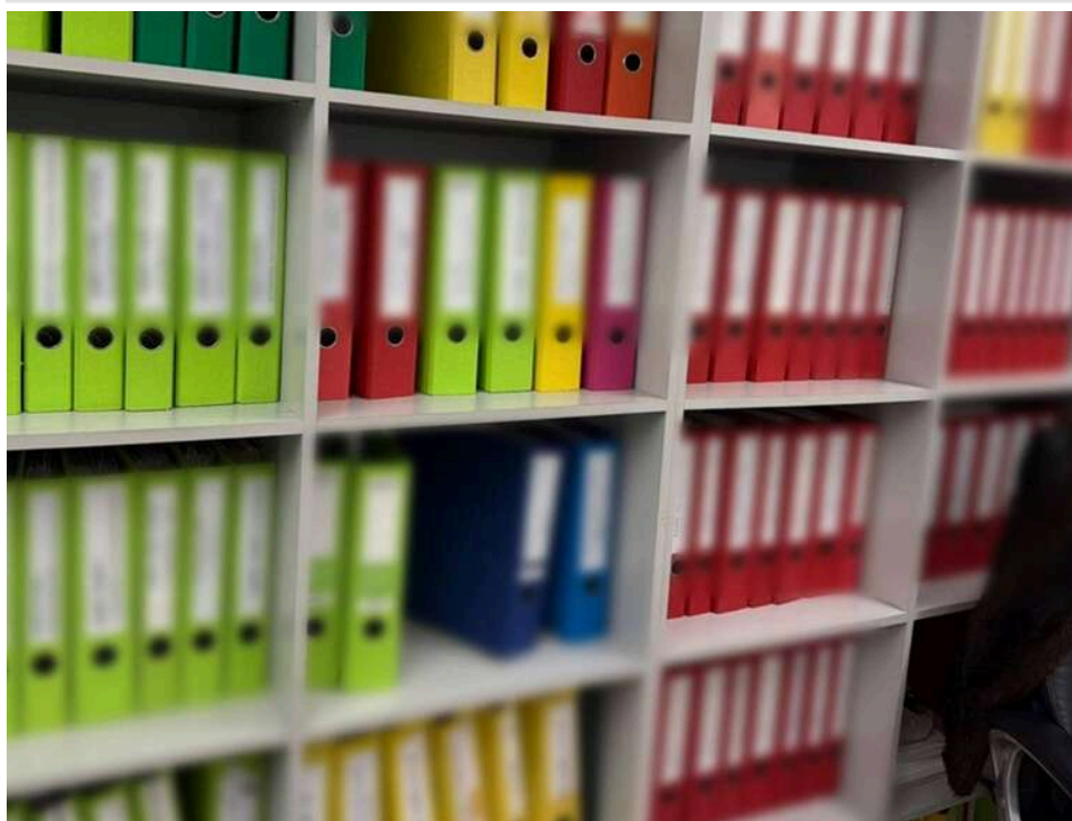
Схема на 386 мільйонів: БЕБ викрило відомого ритейлера, який ухилявся від податків через 3,5 тисячі ФОПів