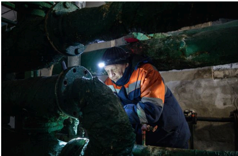
Плани стійкості громад можуть провалитися?