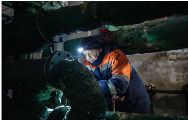
Плани стійкості громад можуть провалитися?

Обирайте перевірене - додайте РБК-Україна до улюблених джерел у Google