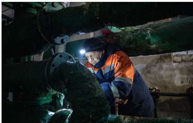
Плани стійкості громад можуть провалитися?

Реалізація планів стійкості українських громад опинилася під загрозою через відсутність фінансування та борг держави за різницю в тарифах. Сума заборгованості перед теплостачальниками сягнула 72 млрд грн.