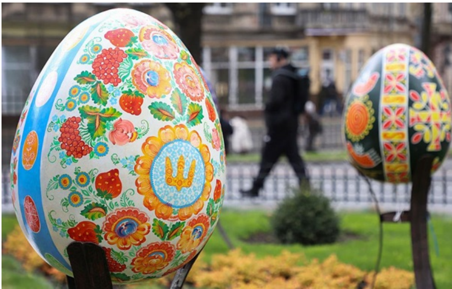
Декоративні інсталяції писанок у Львові

Російська агентура намагається штучно розпалювати конфлікти між представниками різних конфесій та релігійних громад, нагадали у спецслужбі.