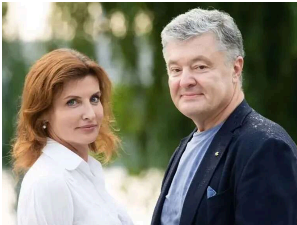
По 8,5 мільярда кожному: Вінницький апеляційний суд остаточно розділив майно Марини та Петра Порошенків

Вінницький апеляційний суд поставив крапку у гучній справі про поділ майна між Мариною та Петром Порошенками. Згідно з рішенням суду від 20 квітня 2026 року, активи подружжя вартістю понад 17 мільярдів гривень були розподілені між сторонами майже порівну.