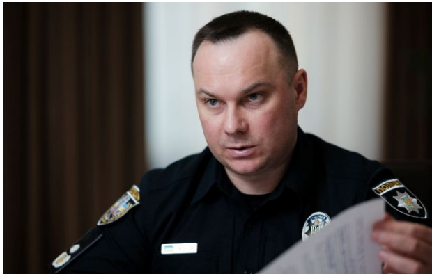
Фото: голова Нацполіції Іван Вигівський

В Україні є випадки, коли поліцейські зупиняють громадян для перевірок і виявляють їх у базах "розшуку", хоча раніше вони доставлялися до ТЦК. Це відбувається з різних причин, наприклад, несвоєчасного внесення даних.