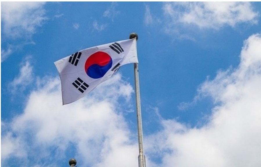
Фото: pixabay.com (ілюстративне фото)

У Південній Кореї запуснуть безкоштовний мобільний інтернет