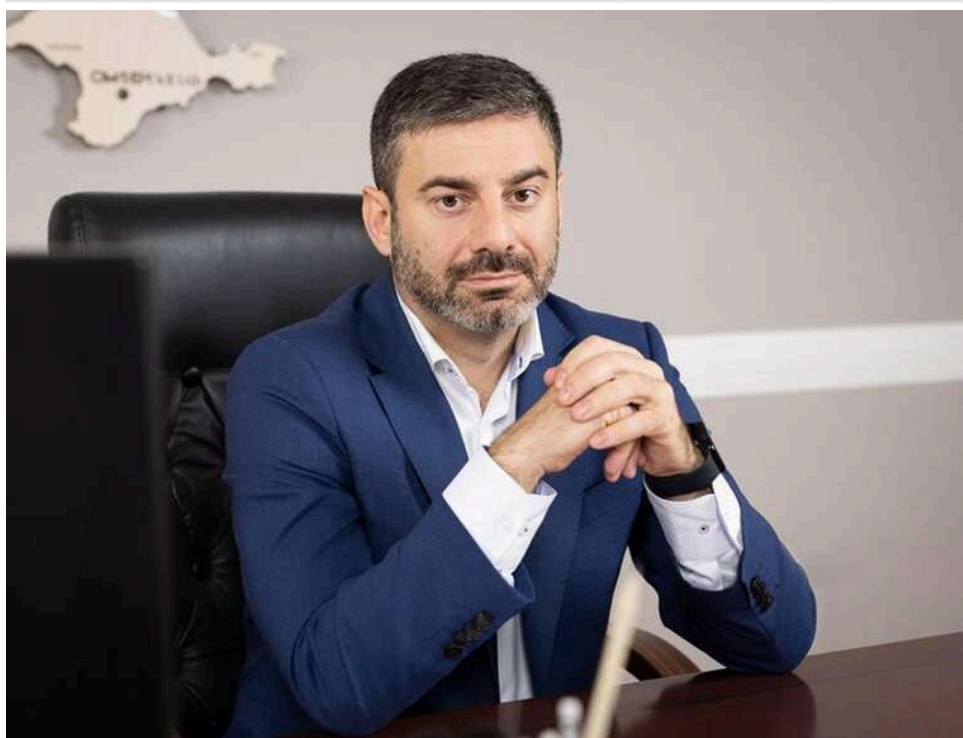
Брехня в цифрах або некомпетентність: Лубінець звинуватив міністерство в спотворенні даних про зруйноване житло

Жителі прифронтових зон не можуть оформити компенсацію за зруйноване житло. Причина в тому, що механізм дистанційної оцінки пошкоджень не функціонує.