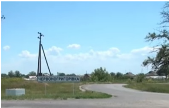
Трагедія произошла в селе Красногригорьевка