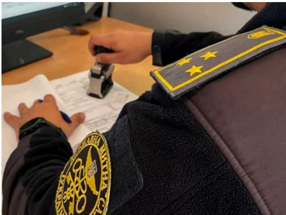
На кордоні з Молдовою виявили незадекларований алкоголь: суд оштрафував громадянку України

Вінницький міський суд виніс постанову у справі про порушення митних правил щодо громадянки України, яка намагалася перевезти через кордон значну кількість алкогольних напоїв без декларування.