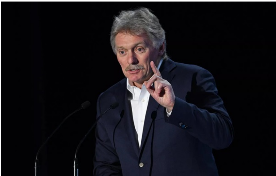
Дмитро Песков знову вимагає виходу ЗСУ з Донбасу

Дмитро Песков чітко дав зрозуміти, що Москва не збирається припинити війну проти українського народу.