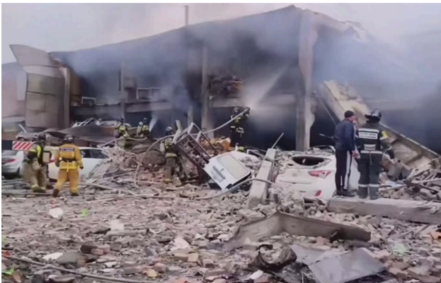
Крім двох загиблих, відомо і про 14 потерпілих внаслідок цього вибуху

Тіло загиблого чоловіка витягли з-під завалів, розповів голова Північної Осетії Сергій Міняйло.