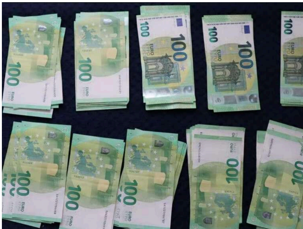
Понад 50 тисяч євро та позашляховик: у Румунії накрили масштабну схему переправлення українців

Співробітники румунської прикордонної поліції затримали громадянина Румунії за контрабанду мігрантів.