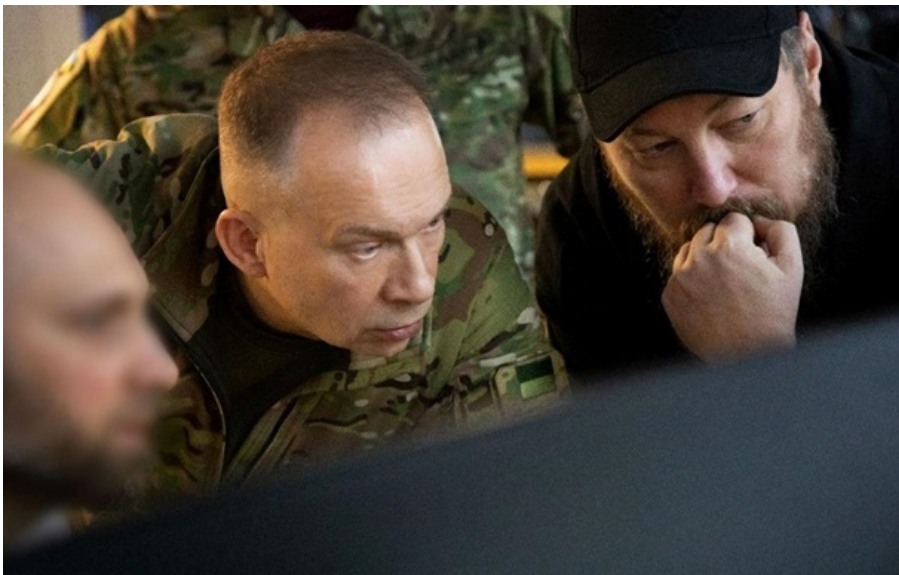
Українське командування контролює ситуацію