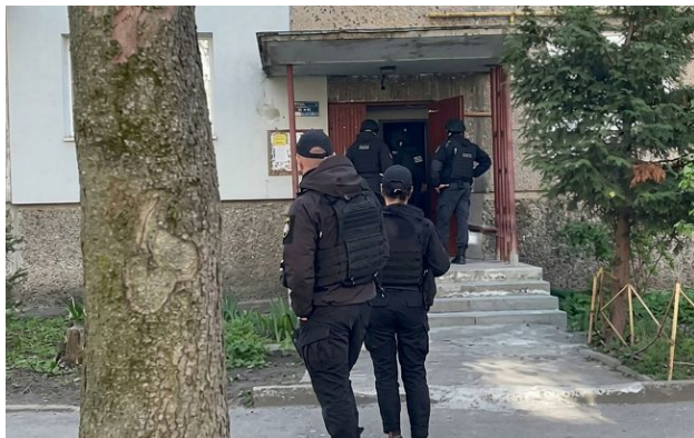
Фото: у Львові чоловік стріляв в багатоповерхівці (скріншот з відео)

Сьогодні, 23 квітня, у Львові в одній із багатоповерхівок було чуто постріли, після чого на місце події прибули правоохоронці та спецпідрозділи поліції.