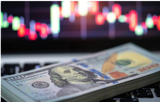
Фото: обмінники та банки оновили курс валют

На валютному ринку 23 квітня спостерігається різноспрямована динаміка: долар фактично стабілізувався, тоді як євро продовжив зниження. Після вчорашнього падіння американська валюта майже не змінилася, а європейська подешевшала.