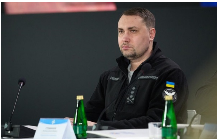
Фото: Пресслужба президента України Кирило Буданов під час поїздки на Закарпаття 9 квітня