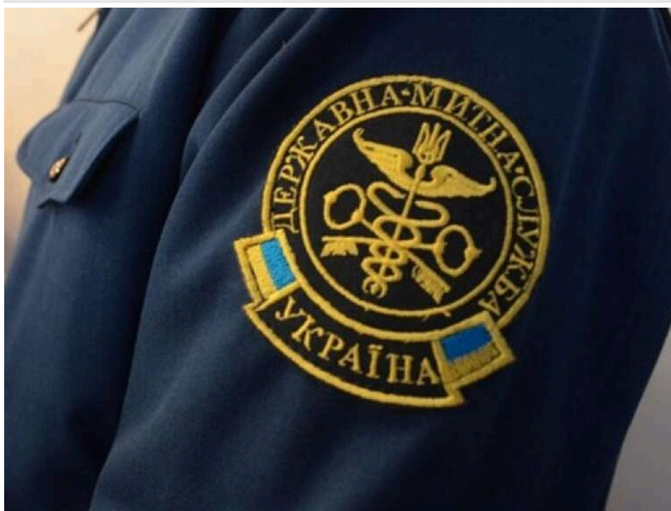
Кугаївський та Пулик на вихід: чому багаторічних керівників ВМО "Ужгород" прибрали з посад та до чого тут незаконна валюта