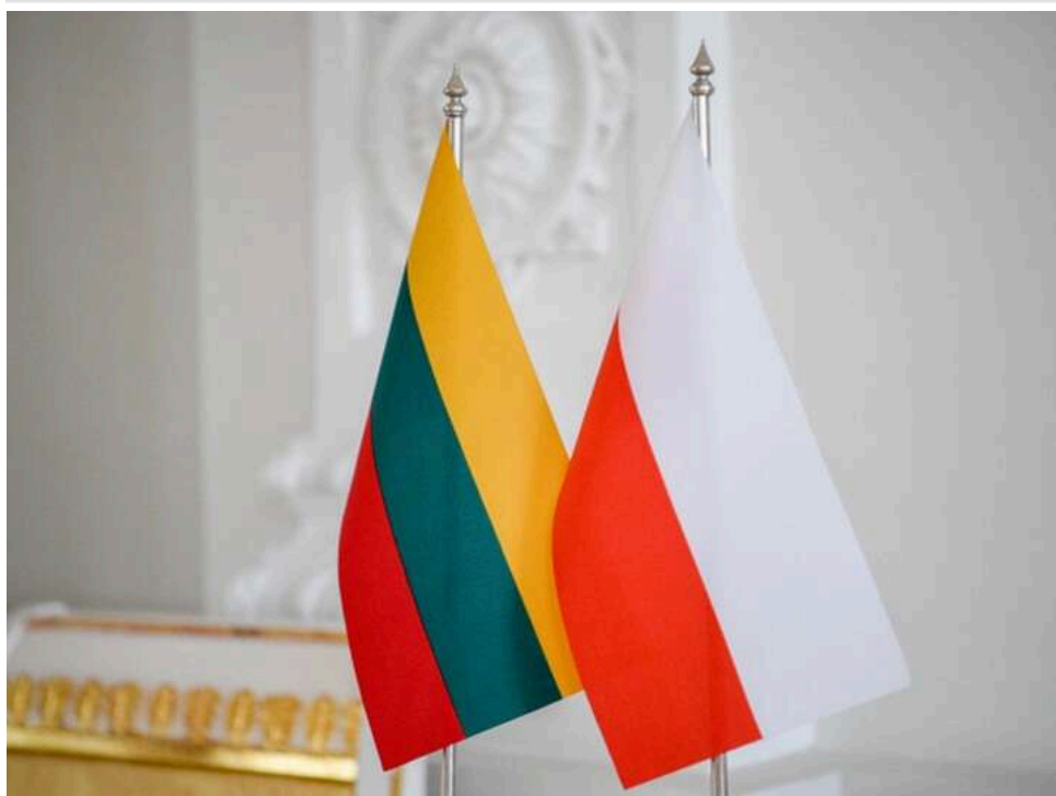
Польща та Литва заявили про готовність прийняти додаткові війська США в разі рішень Вашингтона

Польща та Литва офіційно підтвердили готовність розмістити на своїй території додаткові підрозділи армії США. Країни вже підготувала всю необхідну інфраструктуру для приймання військових і чекають сигналу від Трампа.