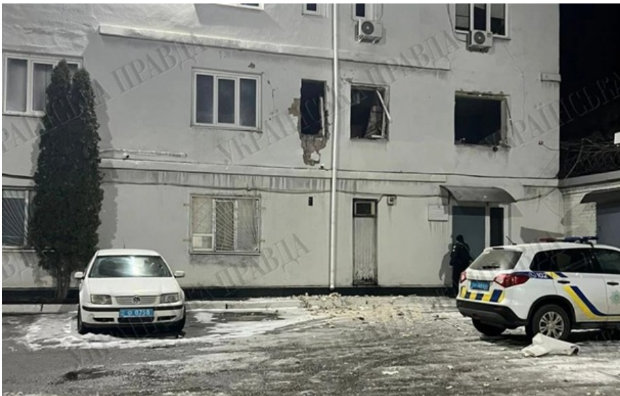
В результате взрыва зафиксированы разрушения здания

Взрыв прогремел внутри здания; зафиксированы разрушения, но, согласно предварительным данным, обошлось без пострадавших.