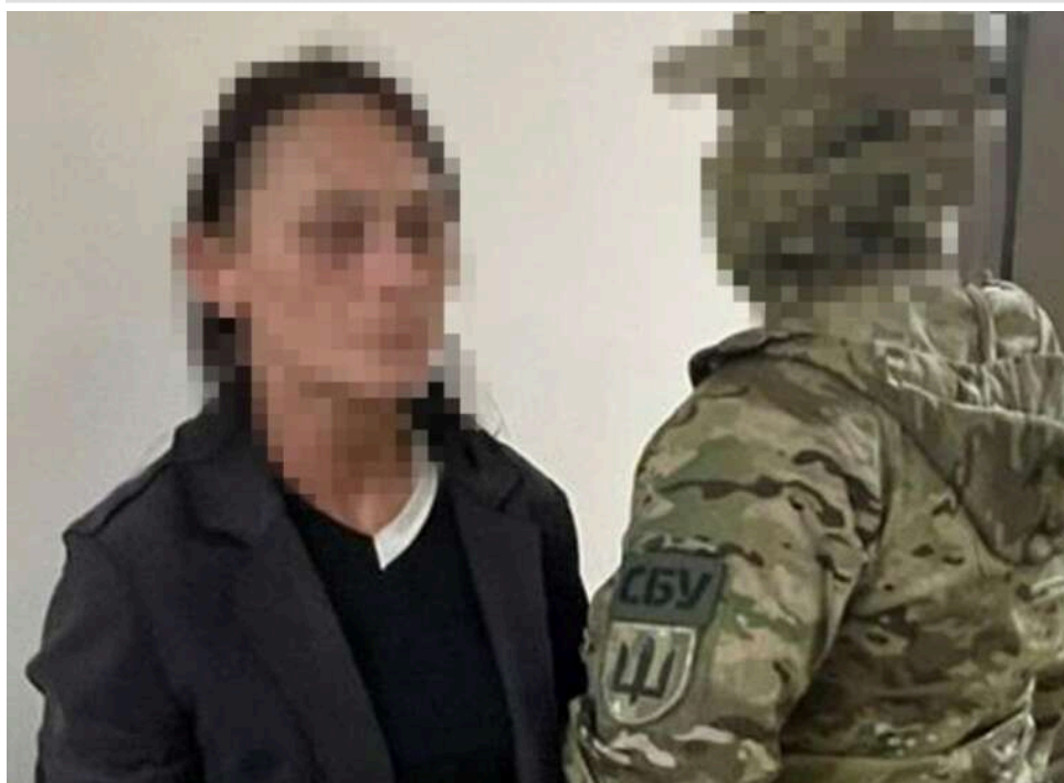
СБУ в Одесі затримала агентку ФСБ, яка готувала замах на офіцера ССО

СБУ затримала в Одесі агентку ФСБ, яка готувала вбивство командира підрозділу Сил спеціальних операцій ЗСУ.