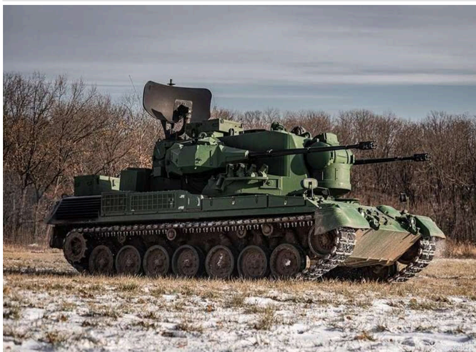
Бельгія передасть Україні 15 зенітних установок Gerard для посилення ППО

Україна отримає від Бельгії партію зенітних самохідних установок для посилення протиповітряної оборони.