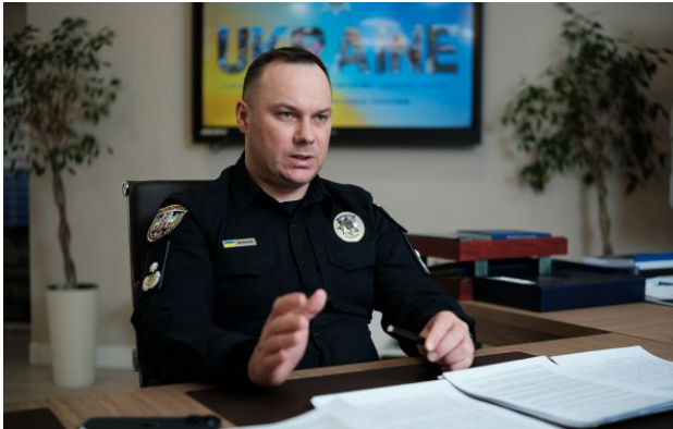
Фото: голова Нацполіції України Іван Вигівський (Віталій Носач, РБК-Україна)

Залучення поліції до мобілізації негативно впливає на її імідж та підриває довіру населення, яку формували роками. У Нацполіції наголошують, що це не їхня основна функція.