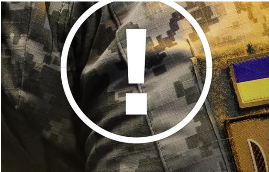
Росіяни розсилають зарені вірусом "додатки"