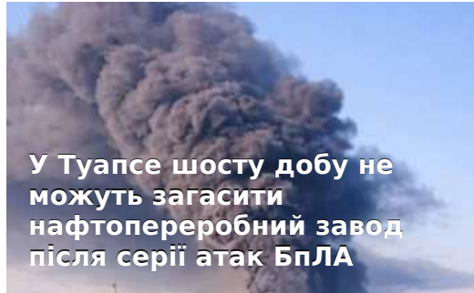
У Туапсе шосту добу не можуть загасити нафтопереробний завод після серії атак БПЛА