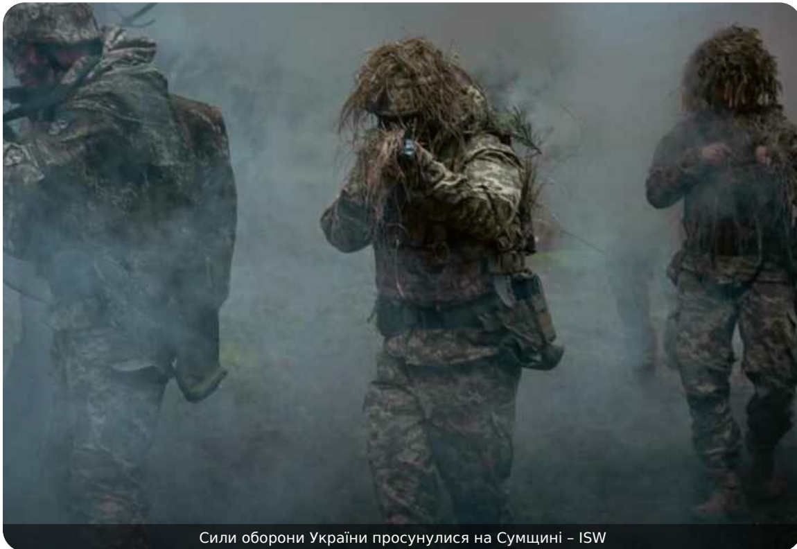
Сили оборони України просунулися на Сумщині – ISW

Сили оборони України продовжують чинити опір російським окупантам у Сумській області та мають успіхи на півночі регіону. Нещодавно бійці ЗСУ зайняли нові позиції поблизу населеного пункту Андріївка.