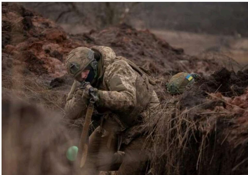
Ситуація на фронті: Сили оборони відбили 159 атак, ворог масовано застосовує авіацію на Запоріжжі та Донеччині

Розпочалася 1520-та доба широкомасштабної збройної агресії РФ проти України. Загалом протягом минулої доби зафіксовано 159 бойових зіткнень.