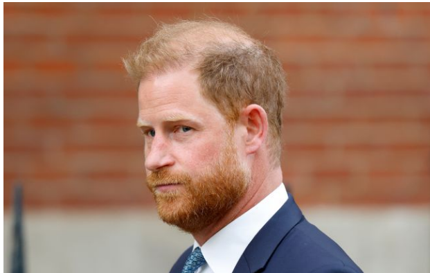
Фото: принц Гаррі (Getty Images)

У четвер, 23 квітня, принц Гаррі прибув до Києва з неанонсованим візитом