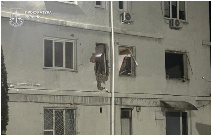
Теракт у відділенні поліції Дніпра

Взрывной волной повреждено административное здание, окна помещения и автомобиль, припаркованный рядом.