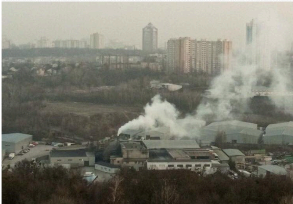
Дим здіймається над заводом «АДМ»

Усі, хто живе поруч з АДМ, звертають увагу, що ці нічні викиди і сморід з'явилися саме з 2022 року, під час повномасштабного вторгнення (і мораторію на планові перевірки підприємств). У той самий період, за даними аналізу інформаційної системи YouControl, АДМ збільшив свої доходи у 2,5 раза (з 367 млн грн за 2021 рік до 850 млн грн за 2025-й), а чистий прибуток — увосьмого (з 2,9 млн грн у 21-му до 23 млн у 2025-му).