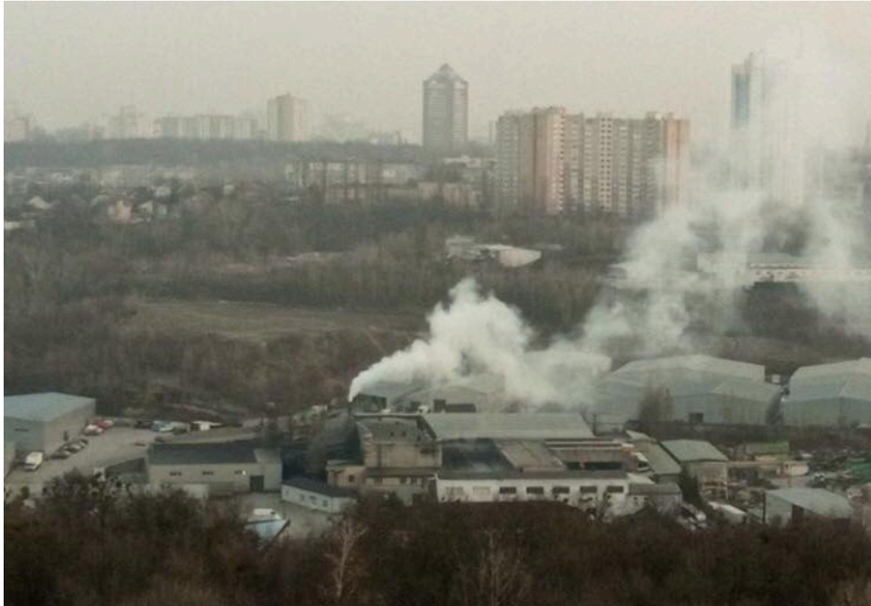
Дим здіймається над заводом «АДМ»

Усі, хто живе поруч з "АДМ", звертають увагу, що ці нічні викиди і сморід з'явилися саме з 2022 року, під час повномасштабного вторгнення (і мораторію на планові перевірки підприємств). У той самий період, за даними аналізу інформаційної системи YouControl, "АДМ" збільшив свої доходи у 2,5 раза (з 367 млн грн за 2021 рік до 850 млн грн за 2025-й), а чистий прибуток — увосьмеро (з 2,9 млн грн у 21-му до 23 млн у 2025-му).