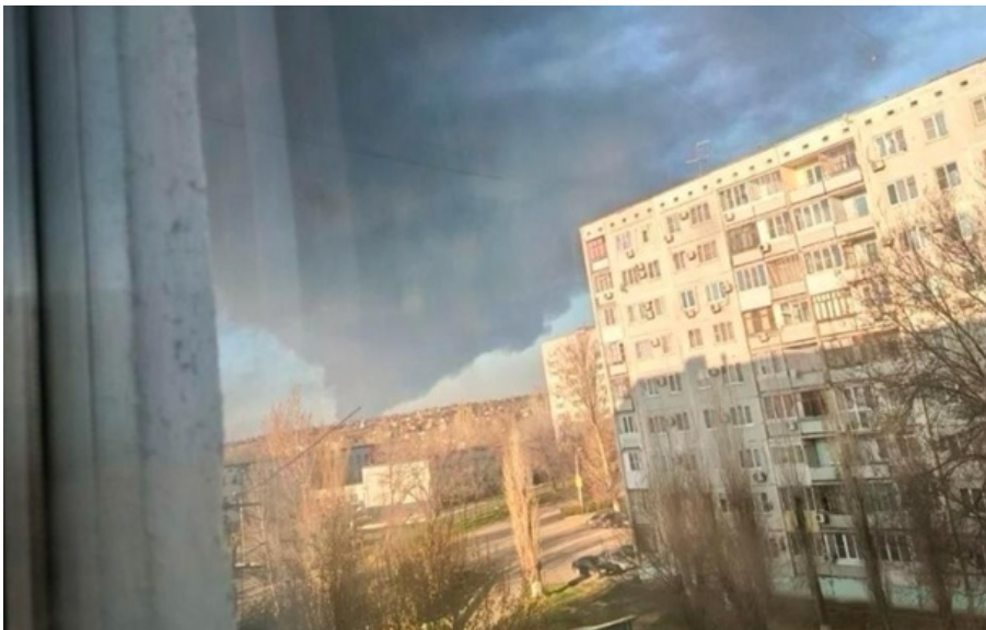
(ілюстративне фото)

Після атаки дронів на перекачувальній станції магістрального нафтопроводу у Волгоградській області РФ розпочалася пожежа