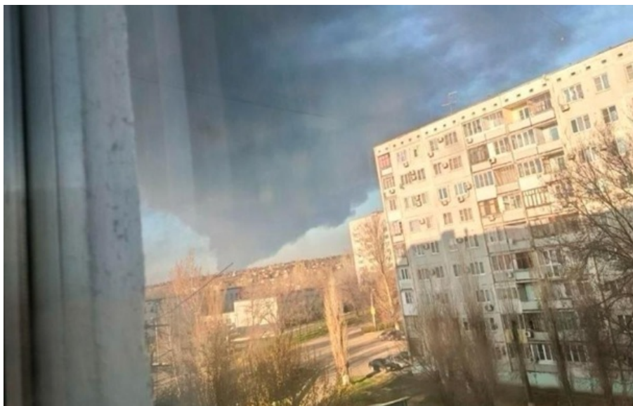
(ілюстративне фото)

Після атаки дронів на перекачувальній станції магістрального нафтопроводу у Волгоградській області РФ розпочалася пожежа