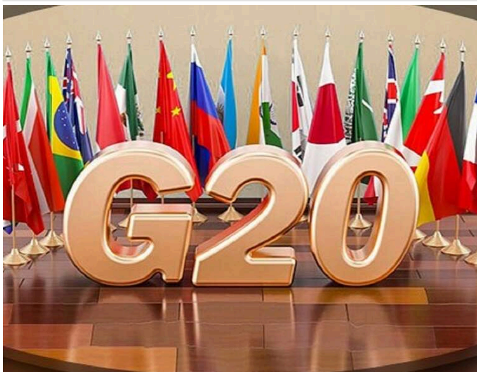
Саміт «Великої двадцятки» в США: Росія отримала запрошення «на найвищому рівні»

У російському МЗС стверджують про запрошення РФ до участі в саміті G20 у Сполучених Штатах на найвищому рівні, який відбудеться в Маямі в грудні цього року.